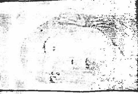
شیخ محمد تقی فلسفی علامه شمشیر